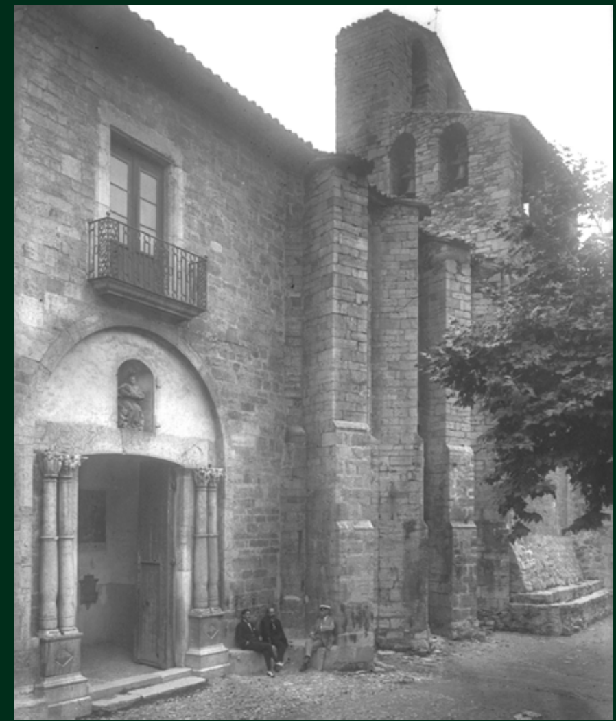
La portada de Santa Maria abans de ser restaurada (ca. 1900)