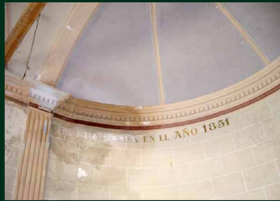
Interior de la capella, decorat al 1851, poc abans del trasllat l'any 2009

La Capella del Roure abans estava situada al carrer Freixenet, a l'indret on, segons es diu, es trobà la imatge de la Mare de Déu del Roure