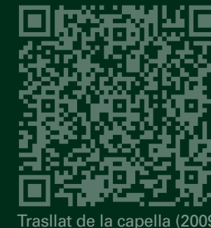
Trasllat de la capella (2009)

Aquesta capella fou construïda pels propietaris de la casa de la Campa, tal com es menciona en uns antics goigs, i s'hi solia acomiadareldoldelsenterraments i celebrar una missa per la festa de les marededéus trobades (8